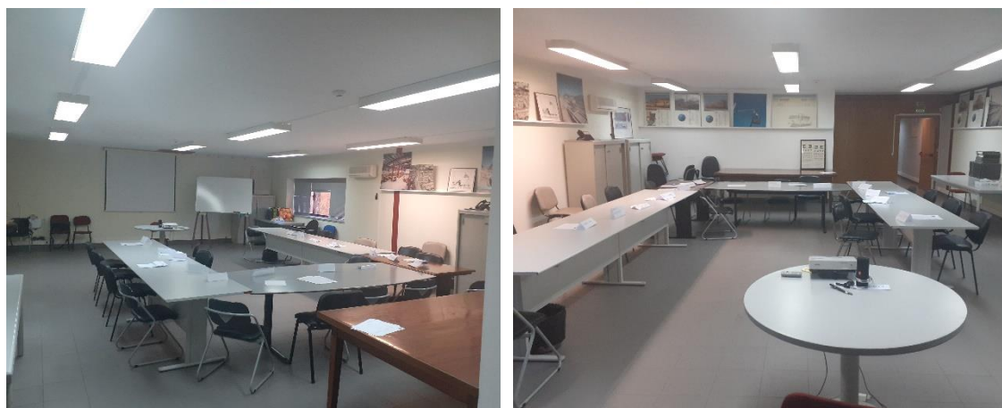
Sala de Formação localizada no Parque Oficial do Carregal do Sal - Oliveirinha