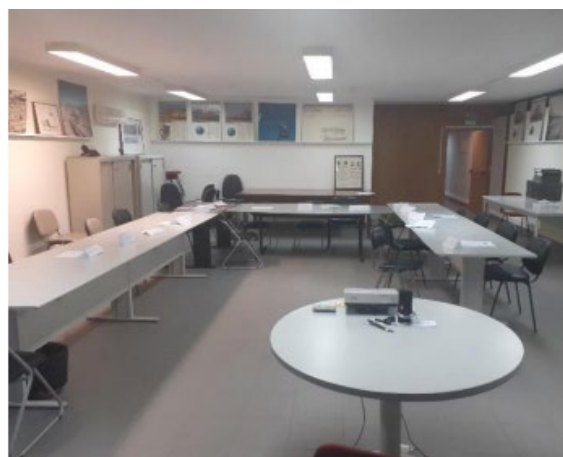
Sala de Formação localizada no Parque Oficial do Carregal do Sal - Oliveirinha